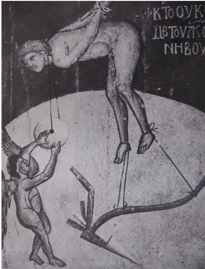
Слика 4 Страшни суд, детаљ Ко украде туђу њиву (В. Петковић, Дечани I и II, Београд 1941, Т. CCLXXIX)

Трећа фреска из Дечана приказује Светог Ђорђа како оживљује вола једног сељака, Свети Ђорђе оживљује Гликеријевог вола . 16 Веома лепо су насликана два вола од којих један лежи, а други се подиже, док је рало само делимично приказано. Наиме, види се јарам и оје и само део раоника троугаоног облика без горњег, ширег дела и продужетка којим се учвршћује на плаз. На основу приказаног дела раоника можемо рећи да припада истом типу као и раоници на претходним фрескама, а