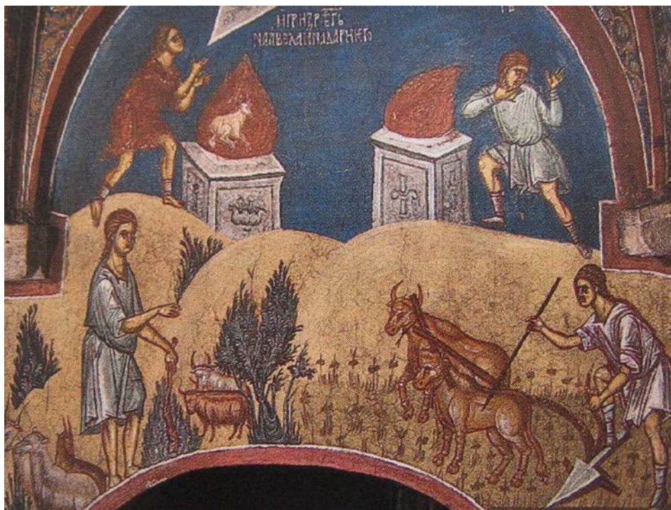
Слика 3 Приношење жртве Каина и Авеља (Б. Тодић, М. Чанак-Медић, Манастир Дечани , Београд 2005, сл. 267)

материјал од кога је рало направљено, раоник од метала, а сви остали његови делови су од дрвета.